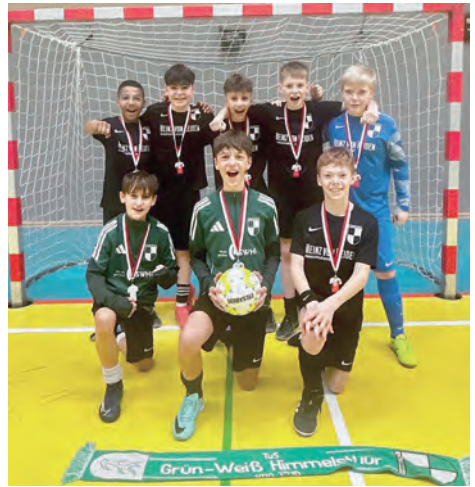
Hildesheimer Vize-Hallenkreismeister bei der Bezirksmeisterschaft in Stadthagen

Am vierten Spieltag kam es schließlich zum Spitzenspiel zwischen dem Tabellenführer und dem Zweitplatzierten. Gegen den JFV Flenithi musste sich unser Nachwuchs trotz einer engagierten Leistung mit 0:2 geschlagen geben. Bis zum Saisonende stehen nun noch die Begegnungen gegen Neuhof und Ochtersum auf dem Programm.