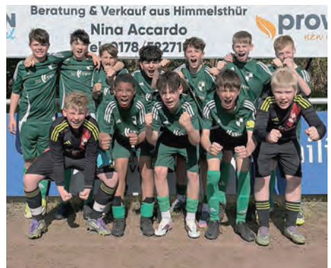
3:1 Sieg gegen die JSG Burgberg