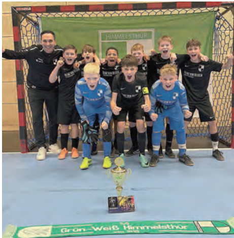
Turniersieg In Hannover

Mit dem Gewinn der Vize-Kreismeisterschaft und einem letzten Turniersieg Anfang März spielte unsere D1 eine starke Hallensaison. Der zweite Platz bei der Kreismeisterschaft bedeutete gleichzeitig die Qualifikation für die Bezirksmeisterschaft. Dort sammelte unser Team viele wertvolle Erfahrungen und präsentierte sich ebenfalls sehr gut. Mit diesen positiven Eindrücken richtete sich der Fokus anschließend auf die zweite Hälfte der Freiluftzeit.