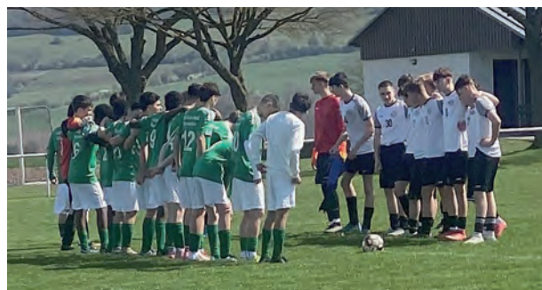
„Begrüßung vor dem Spiel“

uns spielberechtigte Spieler anderer Mannschaften ausleihen, um spielfähig zu sein bzw. über Auswechselspieler zu verfügen. Gegen Ende der Saison waren wir auf einem Turnier bei TürkGücü eingeladen. Hier haben wir eine starke Leistung gezeigt und die meiste Zeit das Turnier dominiert. Leider ist uns zum Ende die Kraft ausgegangen und so mussten wir uns mit Platz 2 zufriedengeben. Rückblickend hat die Mannschaft in der Rückrunde gezeigt was in ihr steckt und wir beenden die Saison im Mittelfeld der Kreisliga. In der nächsten Saison wird die Mannschaft sich wieder neu finden müssen, da altersbedingt einige Spieler in die A-Jugend wechseln. Aus dem jüngeren Jahrgang wird es natürlich auch Spieler geben, die aus der C- in die B-Jugend wechseln werden.