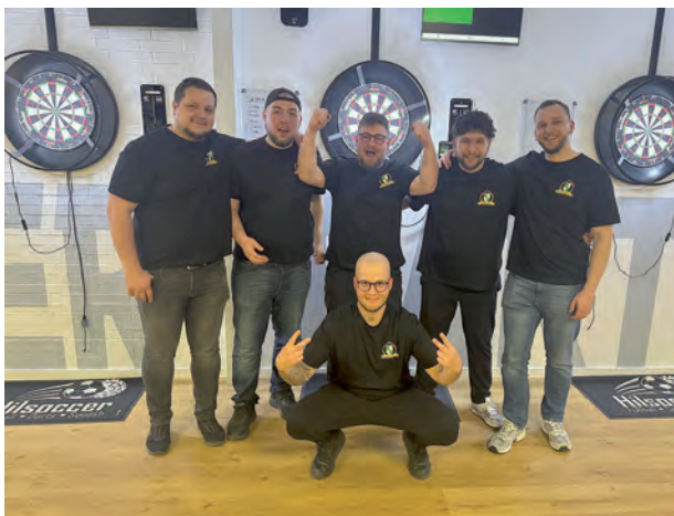
Jubel beim B-Team nach dem Aufstieg!

Ein weiteres Highlight der Saison war die zweite Vereinsmeisterschaft im Darts am 16.05.2026. Eingeladen waren dabei nicht nur die aktiven Dartspieler, sondern auch Mitglieder aller anderen Sparten sowie bereits die Neuzugänge für die kommende Saison.