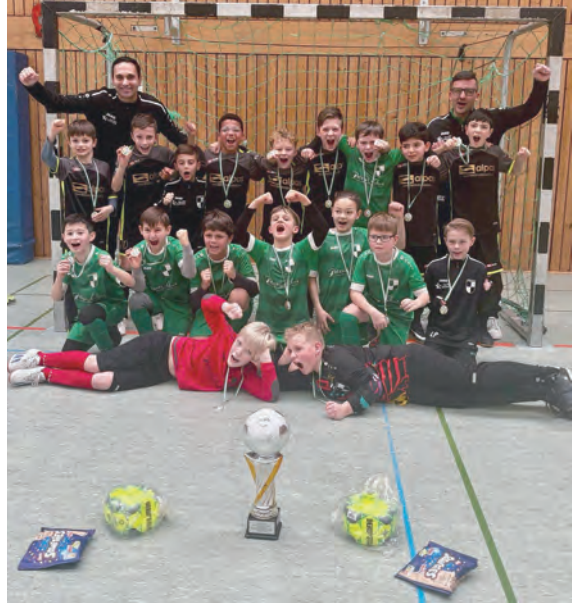
Gewinner des Wanderpokals des 1. Patera Violins Cups: Mannschaft 1 der E1 des TuS Grün-Weiß Himmelsthür

Am 24. Februar 2024 veranstaltete die E1-Jugend (Jg. 2014) erstmals ein eigenes Hallenturnier. Das Turnier wurde zum erfolgreichen Abschluss der Hallensaison 2023/2024. In der BBS Sport-halle Steuerwald versammelten sich acht Jugendmannschaften bereits am frühen Morgen, um den Patera Violins Wanderpokal zu gewinnen. Um allen Spielern im Kader ausreichend Spielzeit zu ermöglichen, hatten wir uns im Vorfeld dazu entschieden, mit zwei Teams anzutreten. Nachdem beide Mannschaften die Vorrunde erfolgreich abschließen konnten, kam es im Halbfinale zum gemeinsamen Duell um den Finaleinzug. Nach einem sehr ausgeglichenen und spannenden Spiel musste der Sieger im 7-Meter-Schießen ermittelt werden. Am Ende konnte sich Team