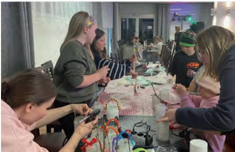
Die Kinder und Trainerinnen der Schwimmsparte beim Basteln während der Weihnachtsfeier

Teelichter basteln, Kekshäuschen basteln, Weihnachtsgerüche erraten und Weihnachtsrätsel lösen, was allen viel Spaß gemacht hat. Anschließend gab es lecker Chicken-Nuggets mit Pommes, was von unseren Vereinswirt zubereitet wurde. Nach 19 Uhr kamen die Eltern und haben die Kinder abgeholt. Vielen Dank für das gute Jahr 2023, das gesamte Team freut sich auf ein tolles gemeinsames Schwimmjahr 2024!