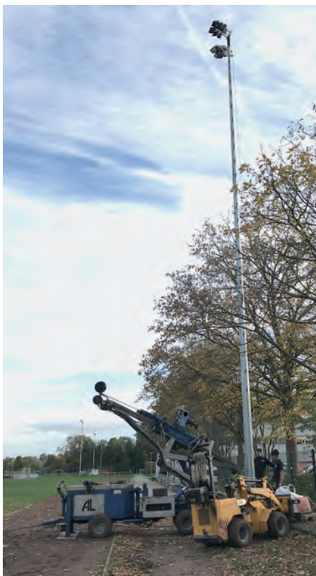
Aufstellung der Masten

ten war beachtlich. Besondere Nervenstärke mussten die Initiatoren mitbringen. Nicht selten waren vermeintlich alle Unterlagen eingereicht, da wurde plötzlich ein neues Gutachten oder ein anderer Antrag erforderlich. Man fühlte sich in gewisser Weise in die Geschichte bekannter Figuren der Freizeitlektüre versetzt. So mag das sicher alles seine Ordnung gehabt haben. Nur zog sich die Abwicklung durch immer neue Aufgaben schier unendlich in die Länge. Besonders ärgerlich war der Fakt, dass die Aufnahme der Arbeiten erst nach final erteilter Baugenehmigung gestattet wurde. Auch das bestimmt sachlich korrekt. Für uns Fußballer bedeutete das allerdings leider eine viel längere Wartezeit bis zur Inbetriebnahme der Flutlichtanlage. Bedanken wollen wir uns ausdrücklich bei den die vielen ehrenamtlichen Helfern für die in Eigenleistung erbrachten Arbeiten. Viele Meter Kabel wurden durch die Schwimmhalle gezogen. Dann im Sportplatz eingegraben. Bei der Pflasterung