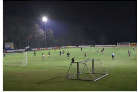
Spielbetrieb bei voller Ausleuchtung, 3:2 Heimsieg der A-Jugend (Landesliga) zur Eröffnung

Anno 2021 machte sich die Sparte Fußball Gedanken, wie denn den vielen fußballbegeisterten Mitgliedern auch in der dunklen Jahreszeit genügend Platz für Training und Punktspielbetrieb bereitgestellt werden kann. Da nur der B-Platz über eine Flutlichtanlage verfügte, hatte sich bei einsetzender Dämmerung die zur Verfügung stehende Trainingsfläche praktisch halbiert. Gab es dann noch unter der Woche Pflichtspiele, konnte parallel kein Trainingsbetrieb mehr stattfinden. Damit wurde man den Anforderungen der zahlenden Mitglieder auf Dauer nicht mehr gerecht. So reifte die Entscheidung, für den A-Platz des Himmelsthürer Sportparks die Planung und Errichtung einer Flutlichtanlage in Angriff zu nehmen.