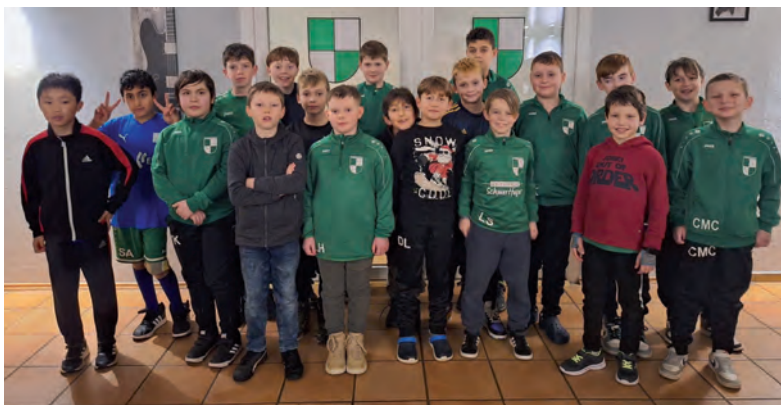
Weihnachtsfeier in der Sportsbar

Die sechs besten E-Jugend Mannschaften aus Hildesheim sollten nun den Kreismeister ausspielen. Für uns lief es gut. Die ersten beiden