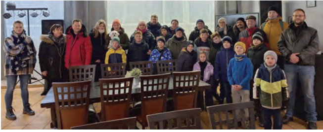
Braunkohlwanderung mit Kindern und Eltern und anschließendem Essen in der Sportsbar

Spiele konnten souverän gewonnen werden. Als nächstes mussten wir gegen AEB spielen und ein frühes Eigentor unsererseits hat unsere Mannschaft total aus dem Konzept gebracht. Es wurde unkonzentriert gespielt, Pässe kamen nicht an... und AEB hat dies eiskalt ausgenutzt und wir mussten uns geschlagen geben. Die letzten beiden Spiele konnten wir wieder gewinnen und da AEB ein Spiel verloren und eins unentschieden gespielt hat, war klar, dass wir E-Jugend Kreismeister sind!! Die Freude war und ist groß und nun sind wir sehr gespannt wer uns am 9.3. bei der Bezirksmeisterschaft alles gegenübersteht.