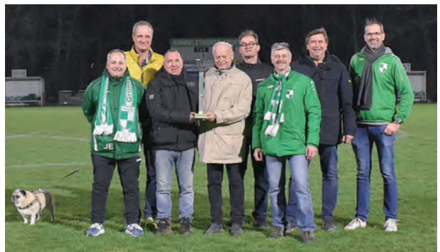
Der Kern der Organisatoren

Zum Verlauf des Projektes könnte man in Form eines Fortsetzungsromans mehrere Vereinshefte füllen. Daher beschränken wir uns auf das Wesentliche. Die Flut von Anträgen und Gutach-