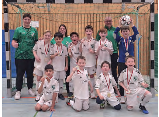
Kreismeister Hildesheim 2024 E-Jugend

Spiele konnten souverän gewonnen werden. Als nächstes mussten wir gegen AEB spielen und ein frühes Eigentor unsererseits hat unsere Mannschaft total aus dem Konzept gebracht. Es wurde unkonzentriert gespielt, Pässe kamen nicht an... und AEB hat dies eiskalt ausgenutzt und wir mussten uns geschlagen geben. Die letzten beiden Spiele konnten wir wieder gewinnen und da AEB ein Spiel verloren und eins unentschieden gespielt hat, war klar, dass wir E-Jugend Kreismeister sind!! Die Freude war und ist groß und nun sind wir sehr gespannt wer uns am 9.3. bei der Bezirksmeisterschaft alles gegenübersteht.