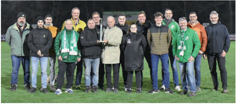
Gruppenbild der Helfer

der Tribüne waren bereits Leerrohre vorge- sehen. Das Ziehen der Kabel durch diese Leer- rohre war jedoch nicht so einfach wie gedacht. Anpassungen wurden nötig. Die Standorte der Masten gegenüber den damaligen Schätzungen mussten verlegt werden.