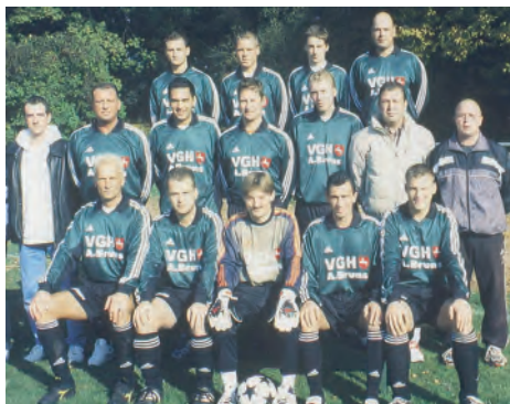
Die Aufstiegs Mannschaft 2003/04

Als Ende der 70er Jahre nach diversen Gebietsreformen die Landkreise Hildesheim-Marienburg und Alfeld fusionierten, ging daraus der Landkreis Hildesheim hervor, der abgesehen von kleineren Veränderungen an den Rändern bis heute seinen Umfang behielt. Nach der Saison 1978/79 reagierte der NFV darauf, indem er die Zahl der Bezirke auf vier reduzierte und die Fußballkreise den politischen anpasste. In Hildesheim gab es