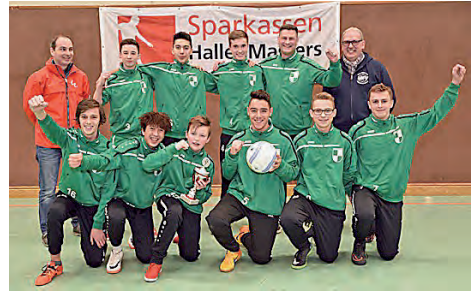
Hallenkreismeister 2018: U16

Anfang April starteten wir in die Rückrunde der Feldsaison. Wie bei vielen Mannschaften litt auch unsere Vorbereitung unter den häufig unbespielbaren Plätzen. Drei lange im Voraus geplante Vorbereitungsspiele konnten nicht durchgeführt werden. Dieses Manko machte sich in unserem ersten Spiel gegen Groß Dünge deutlich bemerkbar und ging mit 2:1 verloren. Nach die-