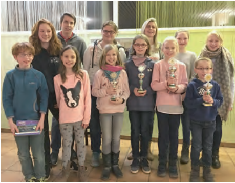
Die geehrten Aktiven während der Jahreshauptversammlung der Schwimmsparte!