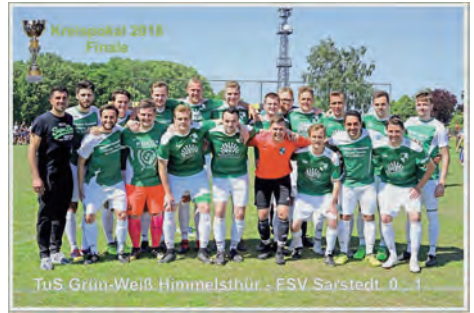
Kreispokalfinalist 2018: I. Herren