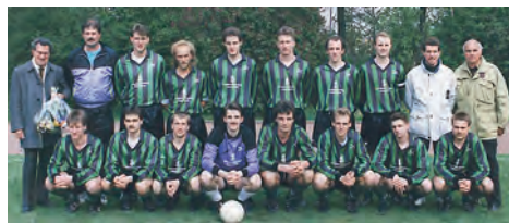
Die Aufstiegs Mannschaft 1990/91