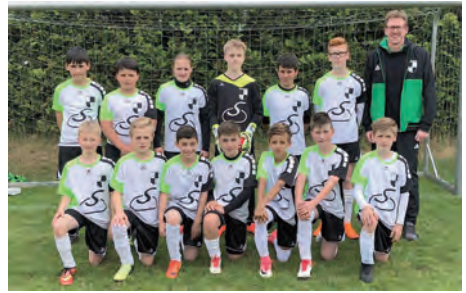
Die U12 beim Fantasia-Cup

chem Ausgang durchführen. In einer Gruppenphase mit anschließenden Platzierungsspielen fanden sehr faire Spiele statt. In der Vorrunde setzten sich in der Gruppe A der AEB Hildesheim und SV Bockenem 2007 und in der Gruppe B der SC Drispstedt zusammen mit dem TuS Grün-Weiß Himmelsthür Weiß durch. Im spannenden Finale zwischen den bereits in der Vorrunde aufeinandertreffenden Mannschaften des TuS Grün-Weiß Himmelsthür Weiß und dem SC Drispstedt reichte uns dann ein Treffer, um das Turnier mit 1:0 zu gewinnen.