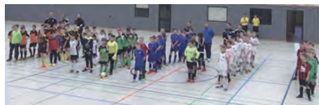
U12-Turnier in der Sporthalle des Gymnasiums Himmelsthür

Bei unserem zwischen den Feiertagen organisierten Hallenturnier in der Gymnasiums-Sporthalle konnten wir ein spannendes Turnier mit erfolgrei-