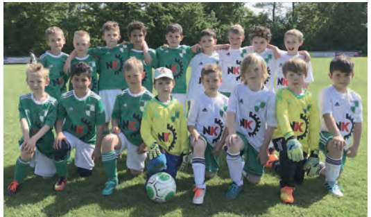
„U8, Jahrgang 2010“

Zur neuen Saison sind wir dann der „ältere Jahrgang“ F-Jugend (U9). Wir werden wieder mit 2 Mannschaften in die Saison 2018/2019 gehen.