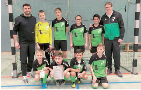
Platz 1 beim Turnier in Bockenem