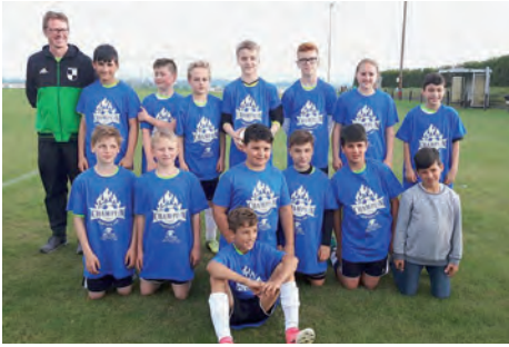
Das Double ist perfekt: Titel verteidigt

Wir, das Trainerteam, sind sehr stolz auf die Leistung unserer Kinder, es macht großen Spaß die mittlerweile nicht mehr ganz kleinen Kicker zu begleiten. Auch in diesem Jahr planen wir wieder einen Saisonabschluss mit den Eltern und der ganzen Mannschaft bei einem Mini-Freundschaftsturnier mit anschließendem Zelten.