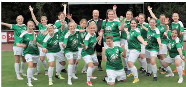
Gute Laune inklusive

Auch du hast Lust, dir ein Bild von Team und Verein zu machen? Dann bist du herzlich eingeladen, eins der Trainings zu besuchen oder uns zu kontaktieren. Auch suchen wir noch motivierte Betreuer*innen oder evtl. Co-Trainer*innen/Torwarttrainer*innen, die Teil des Teams werden möchten. Trainingstage: montags und mittwochs, 19 Uhr - 21:30 Uhr Kontakt: damen@fussball-himmelsthuer.de oder Mario Engelberg (Trainer) 0179/35 33 333