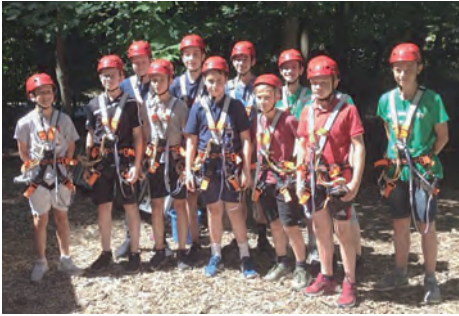
Die U14 im Kletterwald Ilsetal

Spielzeit bestimmten, wurden wir klassisch ausgekontert und standen am Ende mit leeren Händen da. Trotzdem haben die Spiele gezeigt, dass die Jungs im Neuland Bezirksliga durchaus mithalten können und sich vor keinem Gegner zu verstecken brauchen.