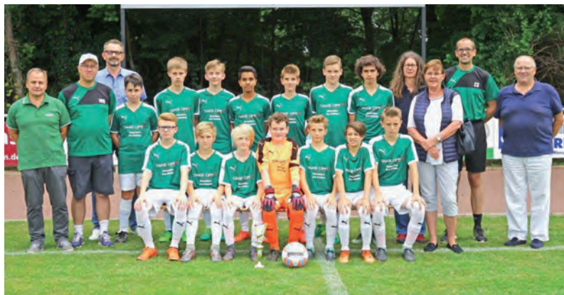
Die U14 des TuS Grün Weiß-Kreismeister 2017/18.

gegen die teilweise jahrgangsaltere und höherklassige Konkurrenz aus dem Ostharz gute Leistungen und belegten am Ende den 4. Platz. Im Modus Jeder-gegen-Jeden konnten zwei Spiele gewonnen werden (2:1 gegen