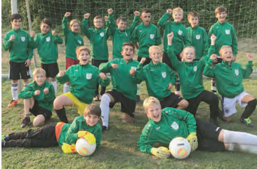
Die U12 mit den neuen Trainingsanzügen ...