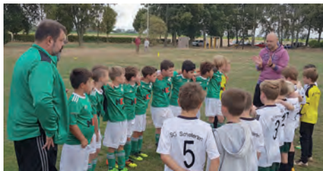
„Teambegrüßung beim Auswärtsspiel“

zeugen. Leider hat sich ein Mannschaftskamerad in der Saisonvorbereitung das Schienbein gebrochen und wird nun mehrere Monate ausfallen. Auch an dieser Stelle wünschen wir nochmal gute Besserung und eine schnelle Genesung. Unsere Spiele werden nach wie vor unter den Rahmenbedingungen der Fair Play-Liga durch-