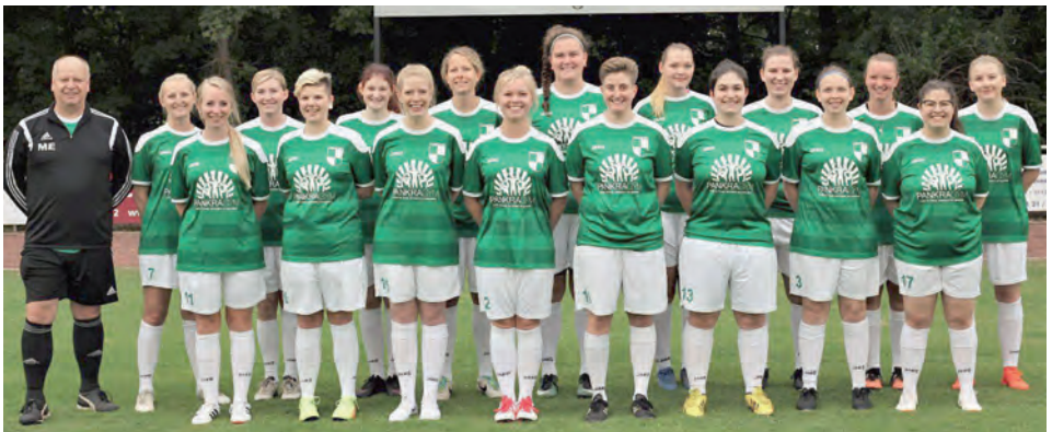
Mannschaftsfoto der gesamten Mannschaft

Inzwischen konnte unsere Damenmannschaft für den Punktspielbetrieb der 1. Kreisklasse Hildesheim gemeldet werden. Gespielt wird 2 x 35 Minuten mit neun Spielerinnen von 16er zu 16er. Die Liga besteht aus sechs Mannschaften. Um den Spielplan zu füllen, hat sich der Spielausschuss dafür entschieden, eine 3er-Runde zu spielen, sodass jede Mannschaft über die Saison 15 Spiele bestreitet.