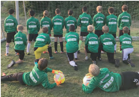
... von der Sportsbar und dem FFV

Nun zu einem kleinen Rückblick unserer U11 Saison in der 2. Kreisklasse. Wir haben eine starke Saison gespielt und mit einer sehr geschlossenen Mannschaftsleistung und einer grandiosen Rückrunde den Sprung auf Platz 3 der Tabelle geschafft, punktgleich mit dem zweiten Platz. Dies haben sich die Kids nach den ersten Lehrjahren mit teilweise deftigen Niederlagen erarbeitet und verdient.