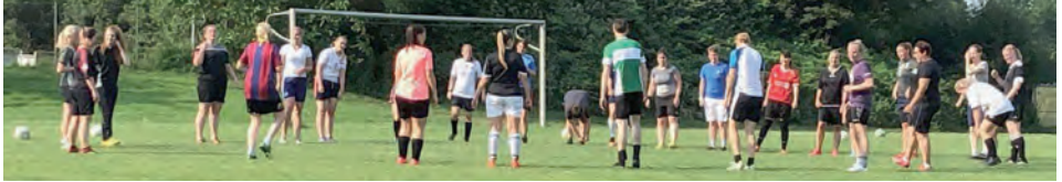
Kennenlernen beim ersten Probetraining

Endlich ist es soweit, der TuS hat wieder eine Fußball-Damenmannschaft!