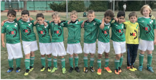
„Ein Teil der U9“

geführt. Hier sollen die Kinder das Spiel selber regeln, deshalb wird auch ohne Schiedsrichter gespielt. Nur in „schwierigen“ Spielsituationen sollen die Trainer unterstützend eingreifen. Mit nun mehr als 3 Jahren Erfahrung lässt sich sagen,